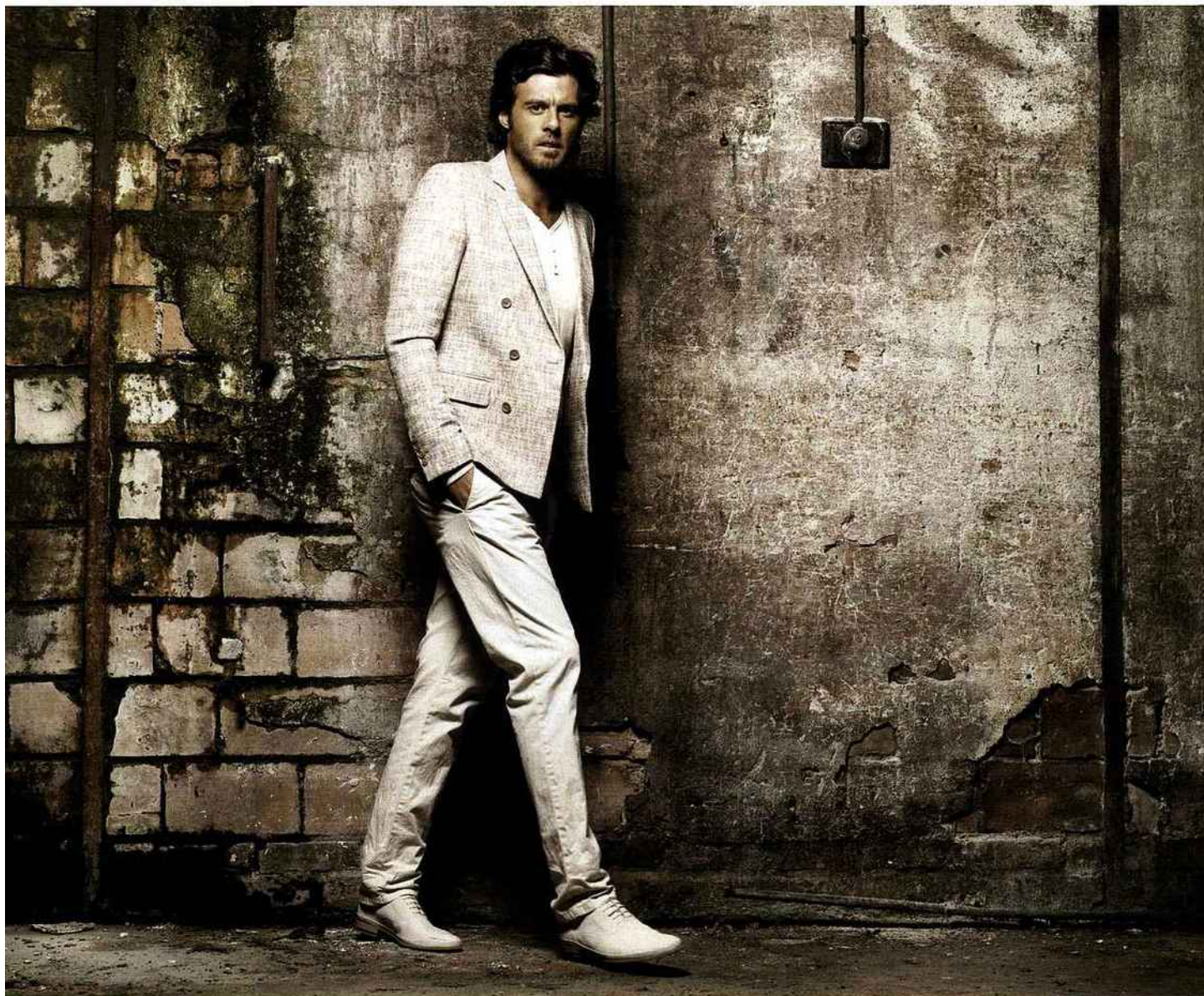
Veste chinée, 530 € (Paul & Joe), tee-shirt tunisien à manches longues en lin et coton, 105 € (Azzaro), chino en coton, 129 € (Tommy Hilfiger). Derbys en cuir, 400 € (Jean-Baptiste Rautureau).