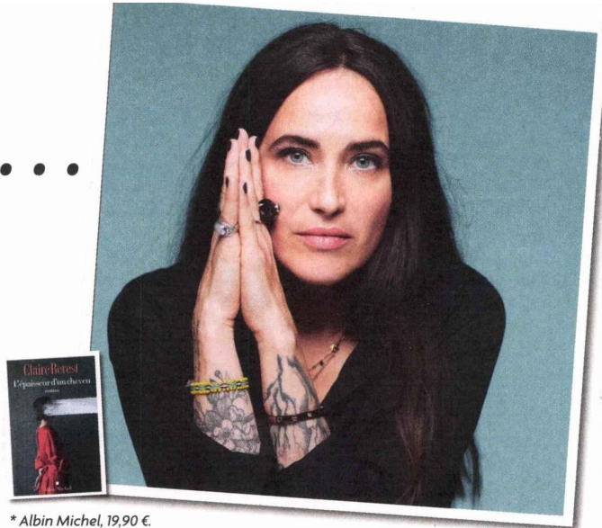
* Albin Michel, 19,90 €.