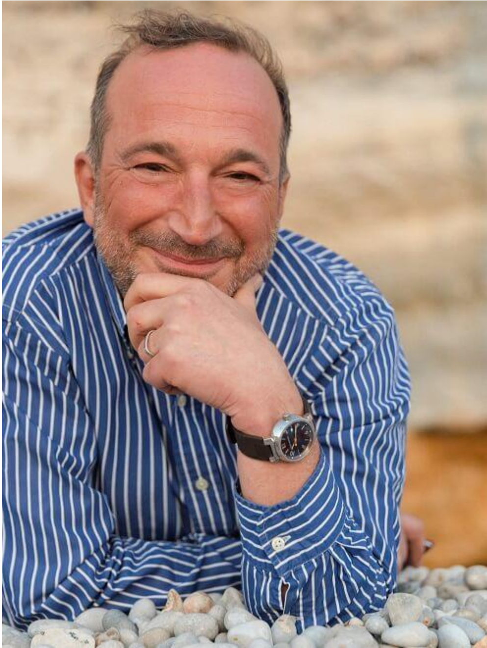
Suivant : Patrick Jacquemin : son livre C'est fait